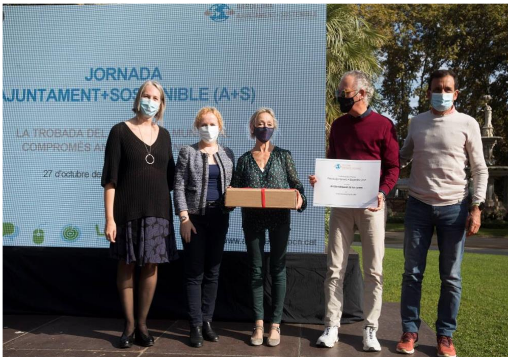
Foto lliurament premis

https://ec.europa.eu/environment/gpp/pdf/news_alert/Issue_99_Case_Study_186_Barcelona.pdf