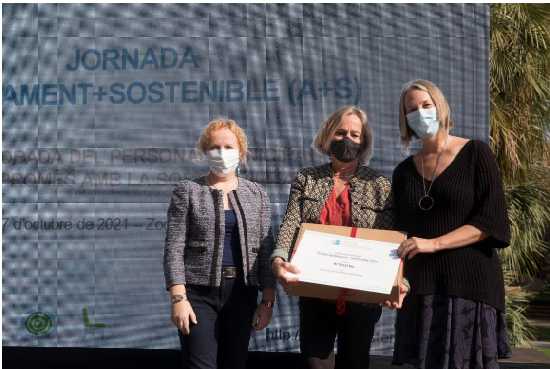
Foto lliurament premis

https://museuciencies.cat/el-nat/les-seus/museu-de-ciencies-naturals-de-barcelona/terrat-viu