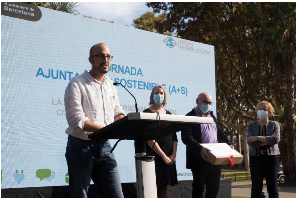
Foto lliurament premis

https://ajuntament.barcelona.cat/premsa/2021/07/11/lajuntament-posa-en-funcionament-el-8e-hort-al-terrat-gestionat-per-persones-amb-discapacitat/