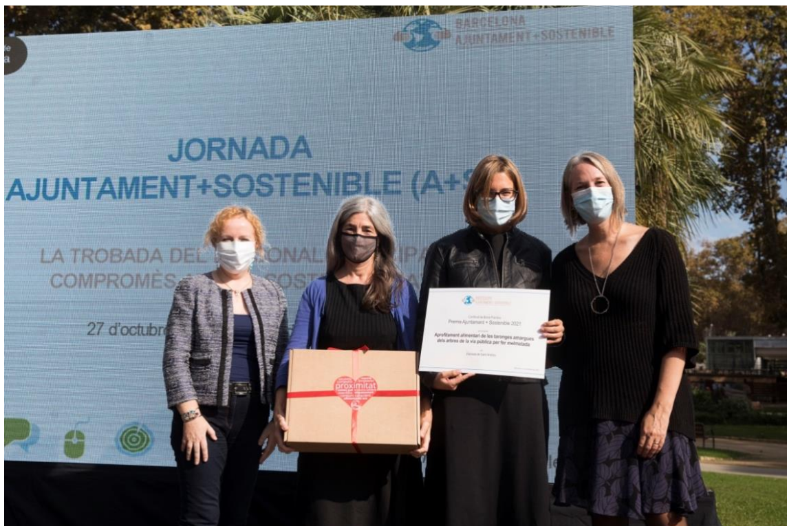
Foto lliurament premis

https://ajuntament.barcelona.cat/premsa/2021/02/20/sant-andreu-aposta-per-laprofitament-alimentari-convertint-les-taronges-dels-seus-carrers-en-melmelada/