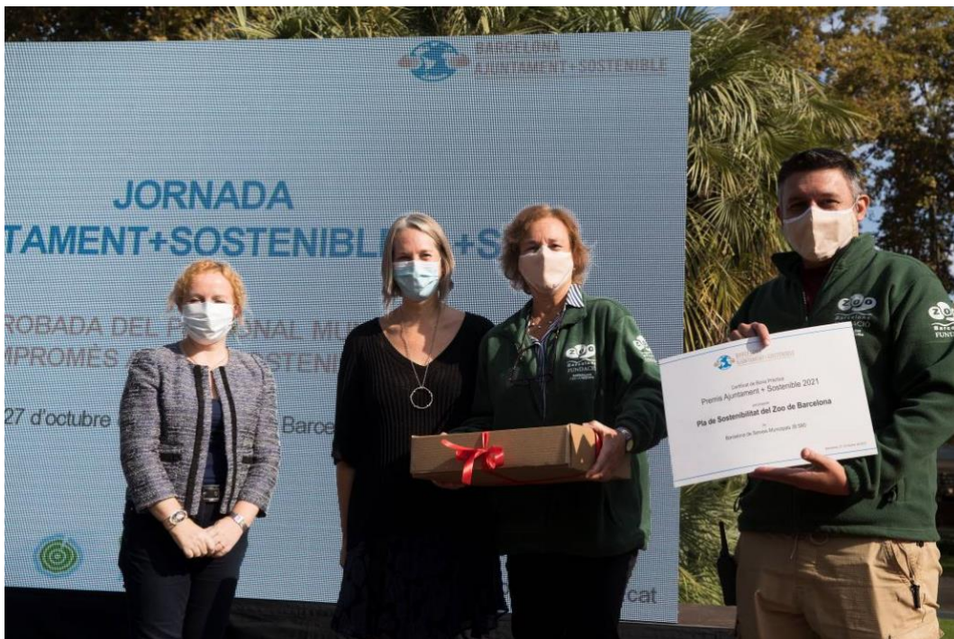
Foto lliurament premis

http://www.ajsosteniblebcn.cat/ca/nou-pla-de-sostenibilitat-del-zoo-de-barcelona_133017