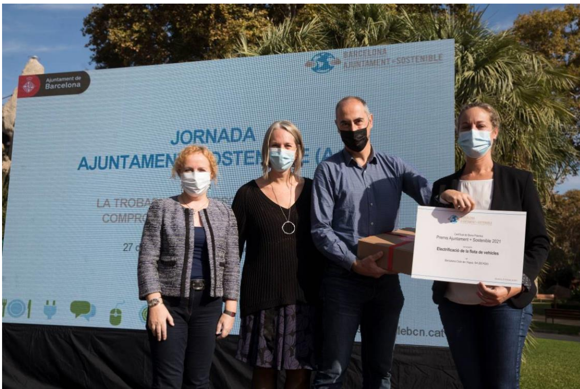
Foto lliurament premis

http://www.ajsosteniblebcn.cat/ca/el-parc-mobil-de-bcasa-ja-es-100-electric-o-hibrid_90065